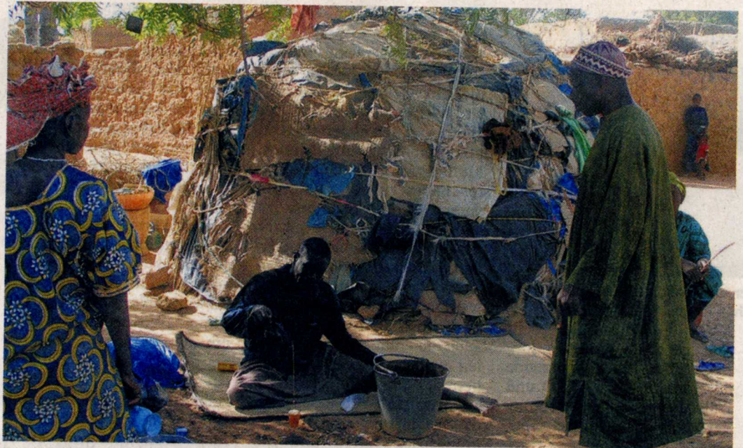
Die Flüchtlinge leben in behelfsmäßigen Zelten, die sie aus Stoff- und Plastikresten gebaut haben.